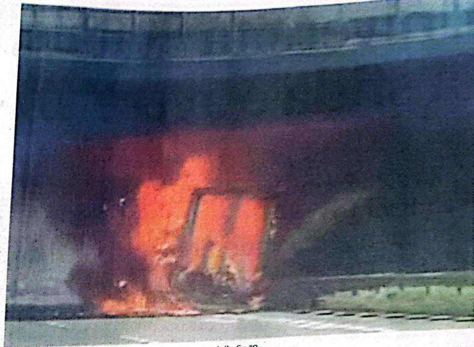
Il rogo. Il camion avvolto dalle fiamme sotto il ponte della Sp 19

Sul posto sono intervenuti i Vigili del fuoco, i tecnici e i cantonieri della Provincia per verificare la stabilità complessiva del ponte ed escludere eventuali danni strutturali mentre le pattuglie della Stradale di Chiari e Iseo e i Carabinieri di Chiari e Gardone Valrompia hanno gestito la circolazione. Come inevitabile infatti, con due importanti arterie stradali chiuse, il traffico è rapidamente andato in tilt e i percorsi alternativi si sono rapidamente congestionati. Solo in serata il traffico è tornato alla piena normalità. //