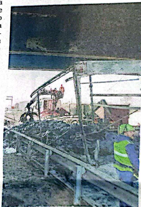
La carcassa. Quel che resta del mezzo pesante