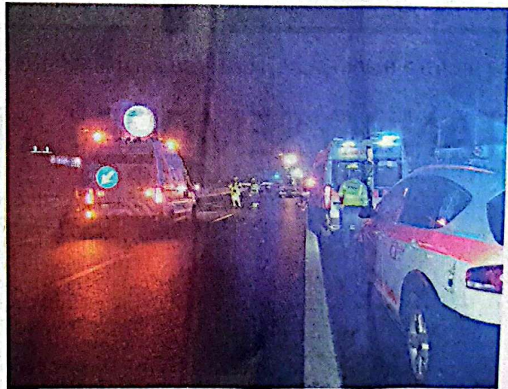
Autostrada bloccata. I mezzi di soccorso arrivati in A4